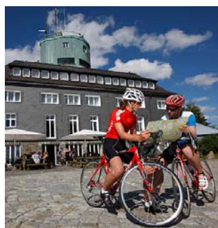
am Asten-Turm | Foto: Agentur Contract

14.03.2017 | (rsn) - Radfahren im Hochsauerland: 600 km ausgeschilderte Radwege, die "Bike Arena" in Winterberg, und seit Juni 2014 auch ein Jedermann-Rennen, das Ende August in seine vierte Runde geht.